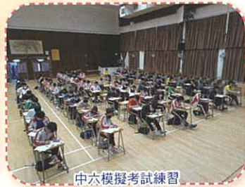
中六模擬考試練習