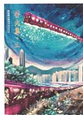
出版學生作文《螢火集》