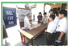
中華文化日「中華藝墟」活動

學校重視價值觀教育，通過不同學習領域、班主任課及全方位學習活動等推展，培育學生十二個首要價值觀和態度，並連繫課堂內外的學習，並加強學生認識國情和培養他們的國民身份認同。