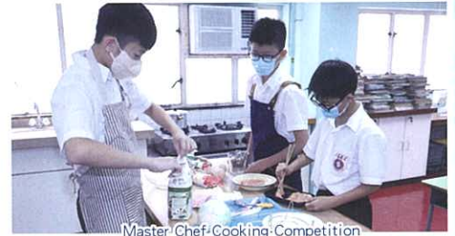
Master Chef-Cooking Competition