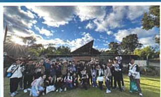
Students are taken on an overseas study trip to Australia to gain more exposure to an English-rich environment