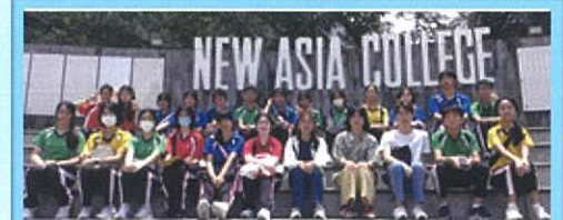
中四及中五本科生參觀香港中文大學藝術系