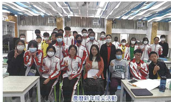
農曆新年拔尖活動