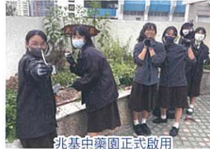
兆基中藥園正式啟用