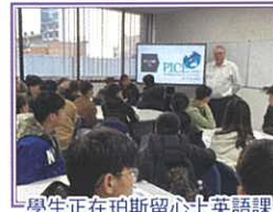
學生正在珀斯留心土英語課