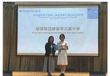
Unicef HK 可持續發展目標網上學習獎勵計劃