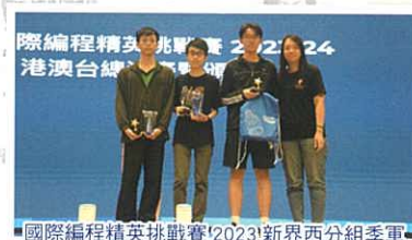
國際編程精英挑戰賽2023新界西分組季軍