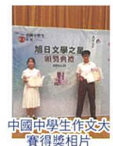
中國中學生作文大賽得獎相片