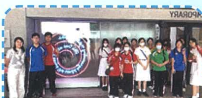
中三同學參觀《布魯斯·瑙曼》大型個展