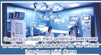
Students unleash their potential every year to make props and backdrops for the annual inter-house mini drama

The English Department offers students the opportunity to improve their English while discovering a new country through the Overseas English Course. To date, our students have enjoyed linguistic and cultural immersion experiences in the UK, Canada, Australia and New Zealand. Students spend their time in an English-speaking country learning the language and participating in daily excursions. They make new friends and experience the culture, food and natural environment. It's a great way to make language learning exciting and practical.