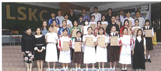
《螢火集》我最喜愛作品選舉