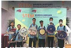
本校同學參加香港城市大學 STEM 嘉年華暨學生專題研發展覽