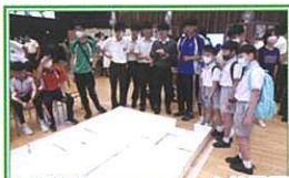
本校舉辦 STEM Fair，向外界展示學生在 STEM 教育中學習成果

學校亦善用不同資源推動 STEM 教育，包括優質教育基金、中學 IT 創新實驗室計劃等，舉辦以 STEM 教育為主題的專題研習和全方位學習活動，豐富學生的學習經歷，並推薦能力較佳的學生參加與 STEAM 教育相關的培訓和校外比賽，希望學生在過程中綜合應用相關科目知識、技能和態度。