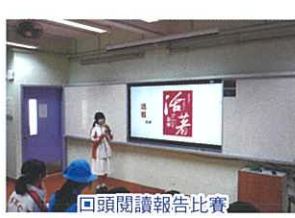
回頭閱讀報告比賽