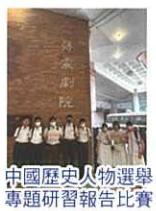
中國歷史人物選舉專題研習報告比賽獲獎