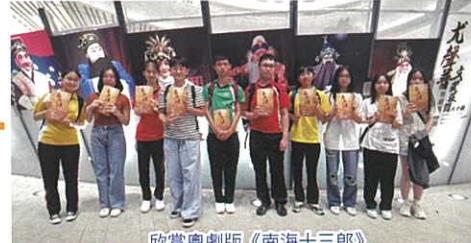
欣賞粵劇版《南海十三郎》