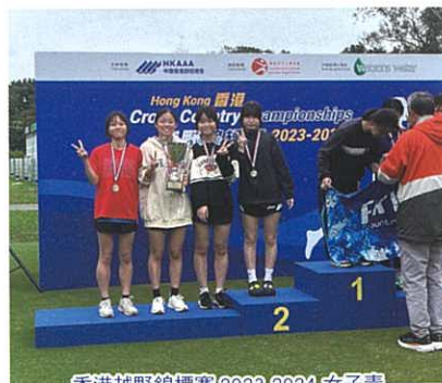
香港越野錦標賽 2023-2024 女子青年組團體亞軍