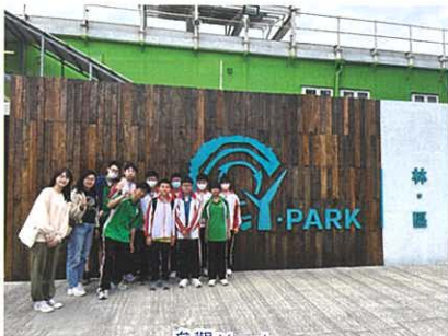
參觀 Y park