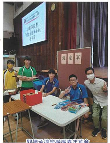
關懷承擔樂融融嘉年華會