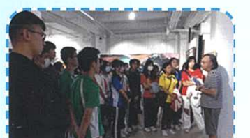
參觀羅宗浩《幽泉亂石流》展覽