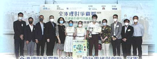
全港理財爭霸戰 2022 設計思維與創新 - 冠軍