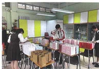
中六同學送上勳勉