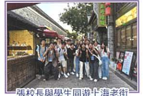
張校長與學生同遊上海老街