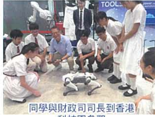
同學與財政司司長到香港科技園參觀

去年本組於試後活動為中二級舉辦了「STEM - microbit 模型氣墊船同樂日」，同學分組製作 microbit 模型氣墊船並於同日進行了比賽。同學都能發揮協作精神、運用編程及科學原理製作自己的氣墊船。