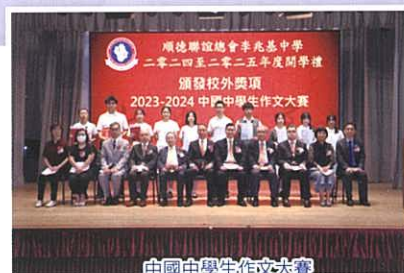
中國中學生作文大賽