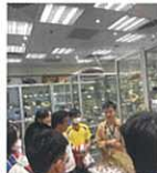
同學到香港生物多樣性博物館參觀