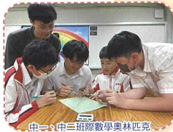
中一、中二班際數學奧林匹克