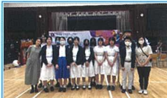
友校顧超文中學師生前來參觀我們的中六畢業展