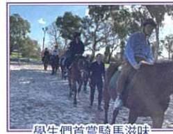
學生們首嘗騎馬滋味