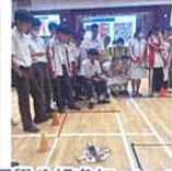
同學分組參加 microbit 模型氣墊船比賽