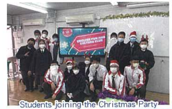
Students joining the Christmas Party