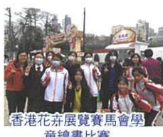
香港花卉展覽賽馬會學童繪畫比賽