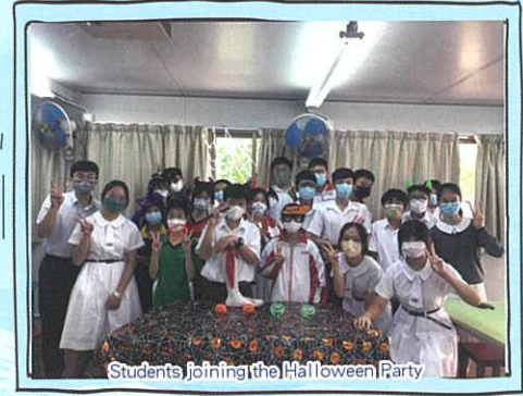
Students joining the Halloween Party