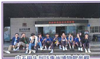
中五學生到訪惠州博物館參觀