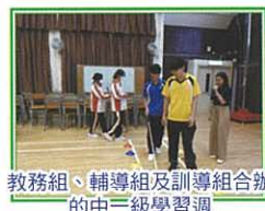
教務組、輔導組及訓導組合辦的中二級學習週

學校關注培養學生自主學習能力，連繫閱讀、電子學習、課前預習、摘錄筆記等策略，促進學生的自學習慣和能力，鼓勵學生自訂學習目標，並通過不斷反思，持續調整學習計劃及策略。學校一直運用不同策略推廣閱讀，並進一步推展「跨課程閱讀」，提供機會予學生有效連繫不同科目知識。