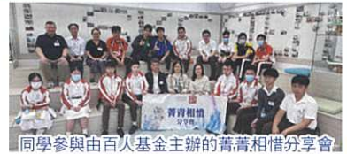
同學參與由百仁基金主辦的菁菁相惜分享會

2023 年 12 月 1 日「兆基中藥園」正式啟用，中四級同學組成中藥園大使，除了負責管理園內植物外，亦在校內推廣中醫藥。5 月 8 日亦邀請到浸會大學中醫藥學院來校舉辦《香港中小學中藥專題展覽》，提升同學對中藥的興趣。