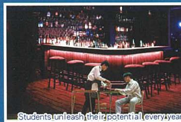
Students unleash their potential every year to make props and backdrops for the annual inter-house mini drama

Teachers have noticed how students' spoken and written fluency in English has been given a boost each year since the programme was run. Through the activity, not only can students' English skills be sharpened, but they also develop soft skills that are essential to leading a good and meaningful life.