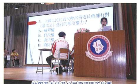
社際基本法及公民常識問答比賽