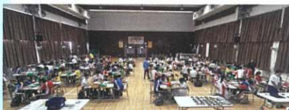
STEM - microbit 模型氣墊船同樂日