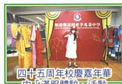
四十五周年校慶嘉年華中「漢服體驗」活動