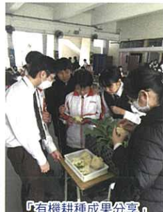
「有機耕種成果分享」 午膳攤位活動