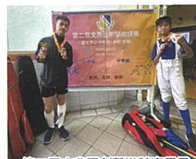
第二屆文燕盃劍擊邀請賽男子重劍冠軍、男子佩劍亞軍