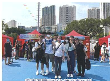
葵青區國家安全教育嘉年華