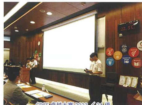
CPCE 卓越大賽 2023/24 優 異獎及評審團嘉許獎

香港理工大學專業及持續教育學院 (CPCE) 主辦「CPCE 卓越大賽 2023/24」，主題為「企業環境保護、社會責任及公司治理 (ESG)」。參賽同學需分析一家在香港真實企業的業務，運用他們創意和批判思維，根據「企業環境保護、社會責任及公司治理」的主題，為該企業制訂一個新的推廣計劃。經過初賽設計市場策劃書，本校其中兩組參賽隊伍脫穎而出，獲選最後五強進行報告演說。最後榮獲優異獎。本校另有三組參賽隊伍獲選最後廿五強，榮獲評審團嘉許獎。